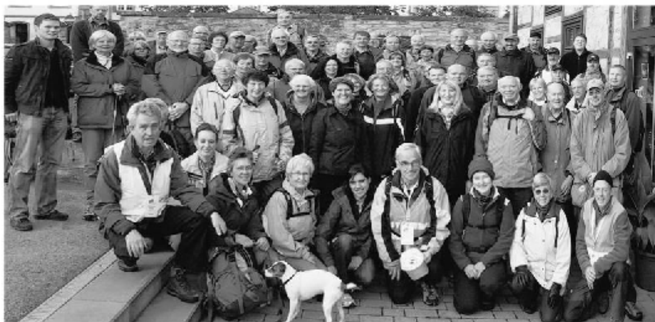
Losgeht's: Die 62 Teilnehmer mit den Wanderführern starteten gestern Morgen am Café Stübchen in die 6. Bürener Wanderwoche