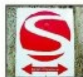
Rechts oder links? Eden an der Wewelsburg.

Wachstel. Der Wanderer könne eine Zeitreise von der Steinzeit und dem Bronzezeit bis in die Gegenwart erleben, sagt der Wanderexperte. Als ein „Zentrum des Wanderns“ bezeichnet der Projektleiter die Region. Der Sintfeld-Höhenweg beruht auf bedeutende überregionale Wander- und Tourismuswege der Europäischen Fernwanderweg E1, der Westfalen-Wanderweg NW, der Diemel-Lippe-Weg oder der Diemel-Lippe-Weg und die 2008 eingeweihte Sauerland-Wald-Route.