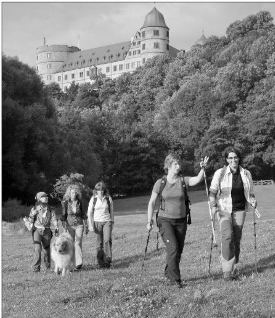
So schön ist das Bürener Land: Vorbei an den Sehenswürdigkeiten wie der Wewelsburg gehen Wanderer bei der sechsten Bürener Wanderwoche ab Montag, 5. Oktober.

Die kürzeren Touren sind so genannte Themenwanderungen. Sie bieten dem Wanderer jeden Tag ein abwechslungsreiches Kulturprogramm. So werden eine Mühlentour mit einer Besichtigung der historischen Mittelmühle, die traditionelle Försterwanderung mit den Förstern Ulrich